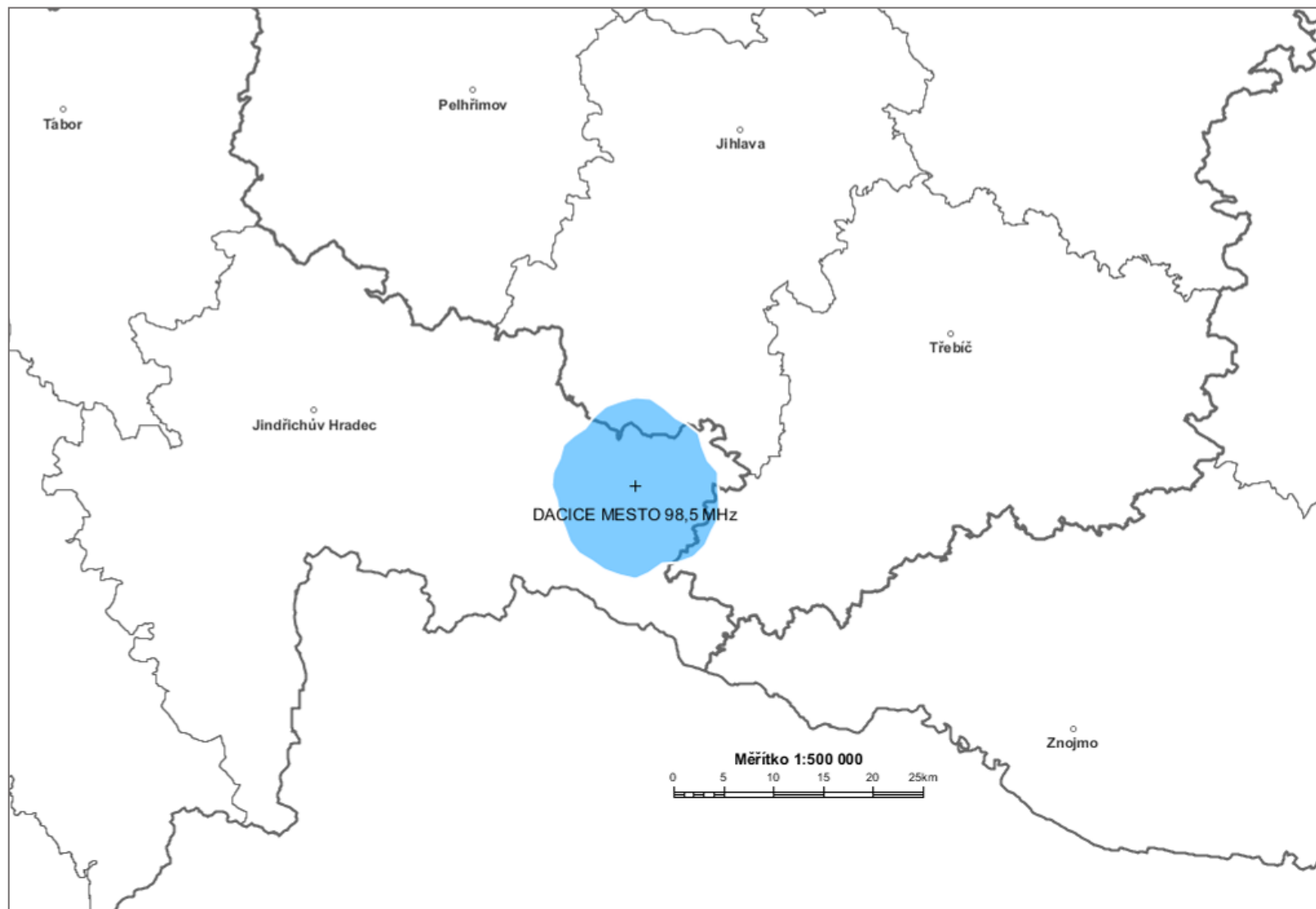
Diagram využití rádiových kmitočtů určených pro analogové vysílání v pásmu VKV pro vysílač DACICE MESTO 98,5 MHz stanovený výpočtem podle vyhlášky č. 22/2011 Sb. (modrá barva).