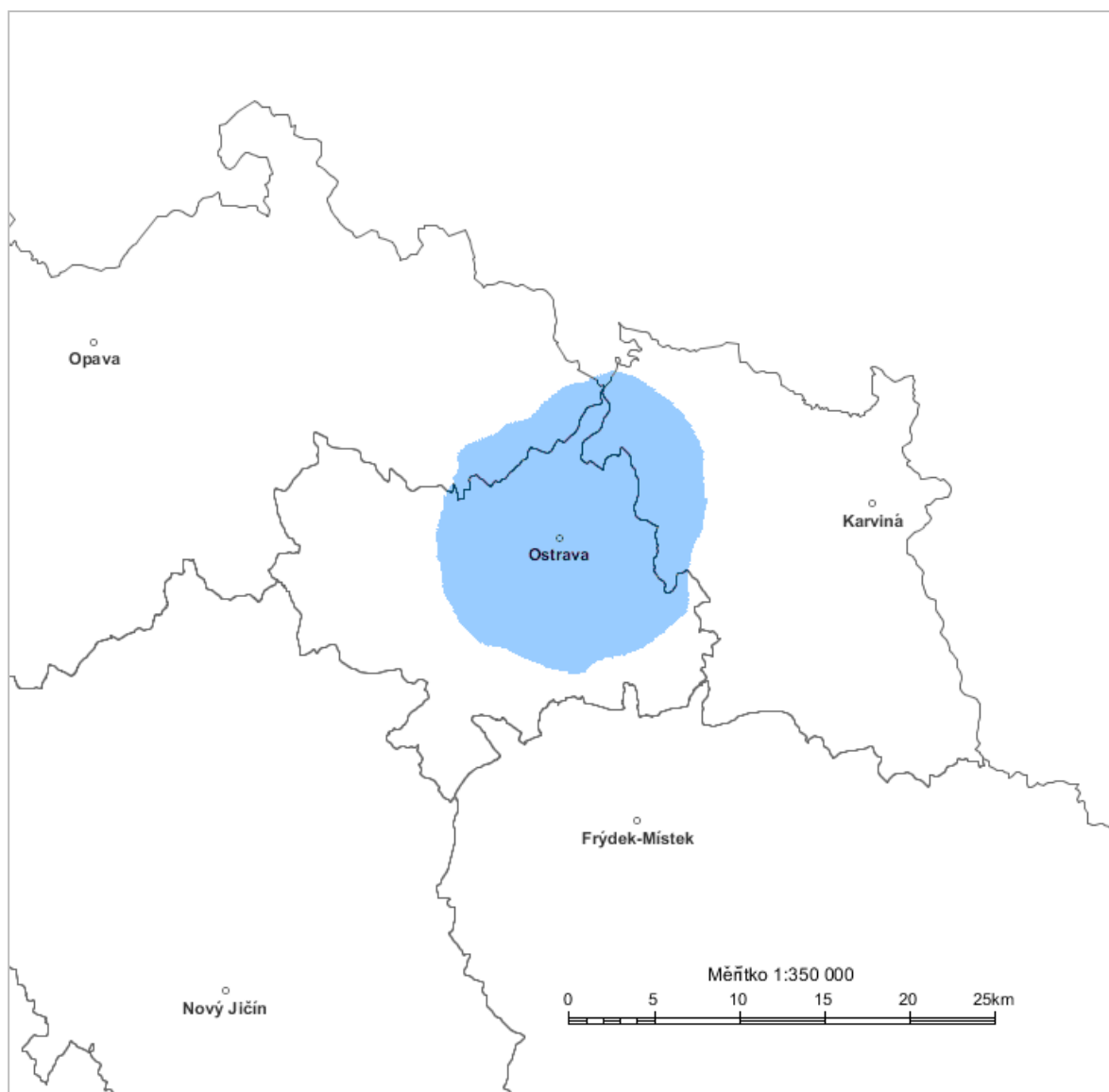
Diagram využití rádiového kmitočtu OSTRAVA SLEZSKA OSTRAVA II 90,4 MHz stanovený výpočtem podle vyhlášky č. 22/2011 Sb. o způsobu stanovení pokrytí zemského rozhlasového vysílání ve vybraných kmitočtových pásmech – modrá barva.