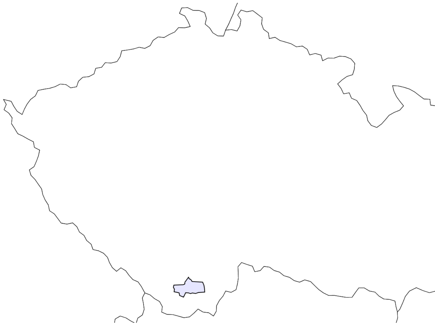
Územní rozsah vysílání – DVB-T vysílač ČESKÝ KRUMLOV kanál 47 (České Radiokomunikace a.s.)