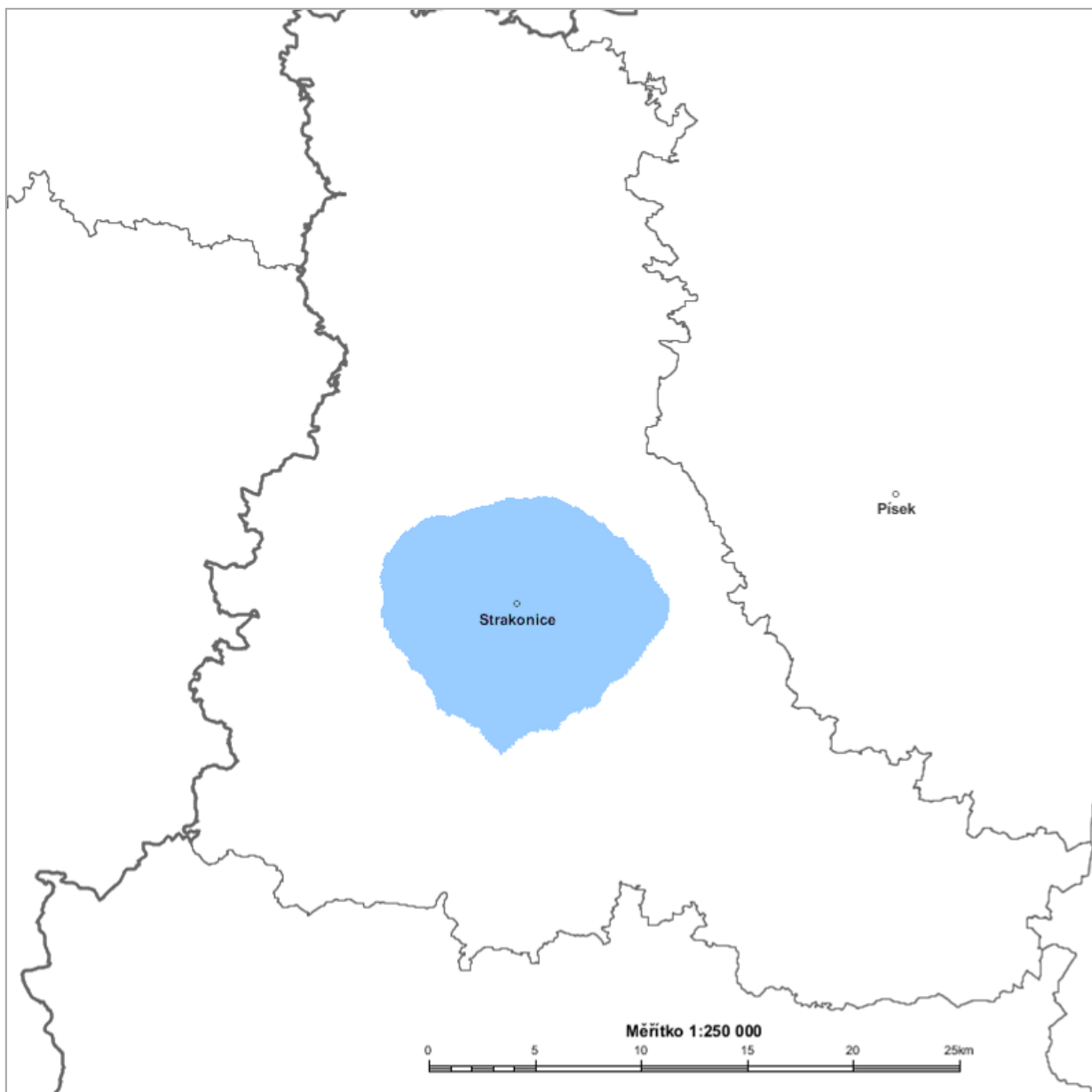
Diagram využití rádiového kmitočtu STRAKONICE 4 88,3 MHz stanovený výpočtem podle vyhlášky č. 22/2011 Sb. o způsobu stanovení pokrytí zemského rozhlasového vysílání ve vybraných kmitočtových pásmech – modrá barva.