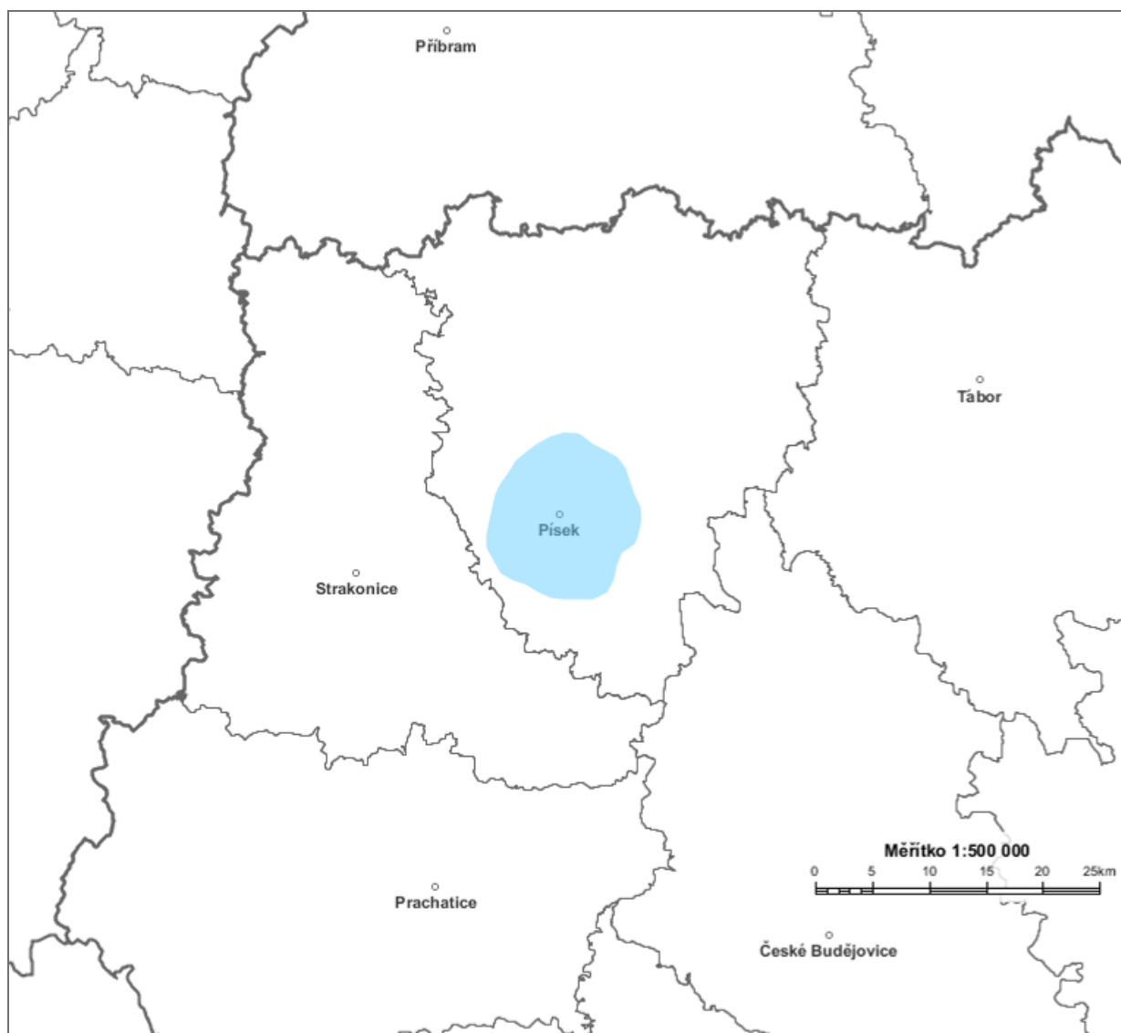
Diagram využití rádiových kmitočtů určených pro analogové vysílání v pásmu VKV pro vysílač PISEK MESTO 3 92,2 MHz stanovený výpočtem podle vyhlášky č. 22/2011 Sb. (modrá barva).