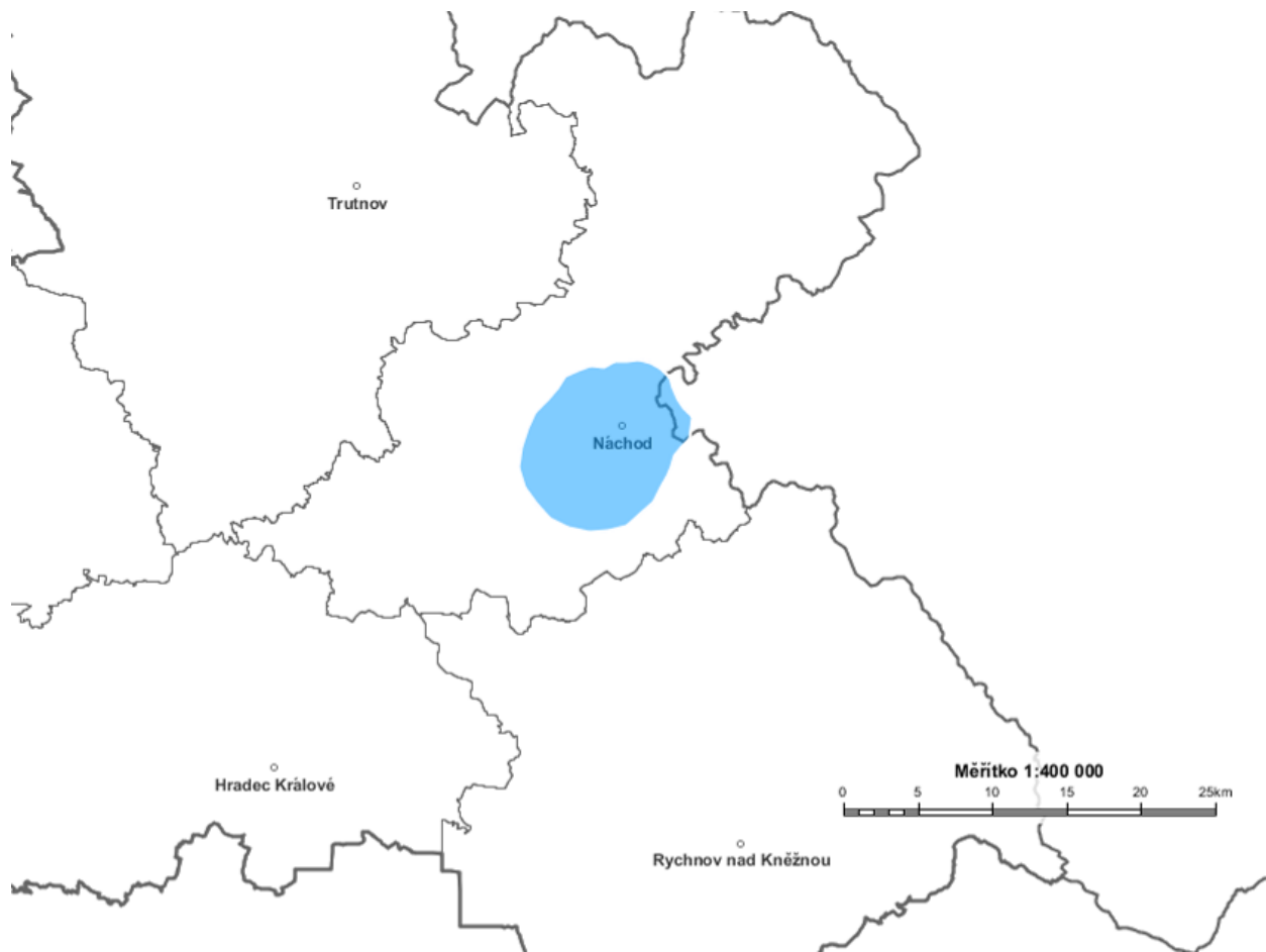
Diagram využití rádiových kmitočtů určených pro analogové vysílání v pásmu VKV pro vysílač NACHOD 3 99,7 MHz stanovený výpočtem podle vyhlášky č. 22/2011 Sb. (modrá barva).