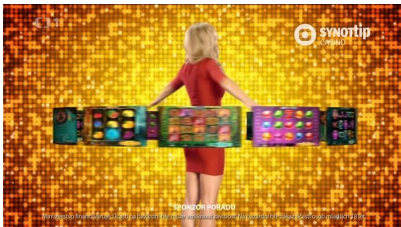
Mladá žena a kolem ní obíhající obrazy se začnou plynule měnit v ruletu: