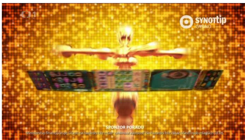
Větší ukázkou mj. dokumentujeme nápisy a logo SYNOTtip CASINO v obraze: