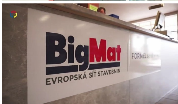
reklamní spot s logem