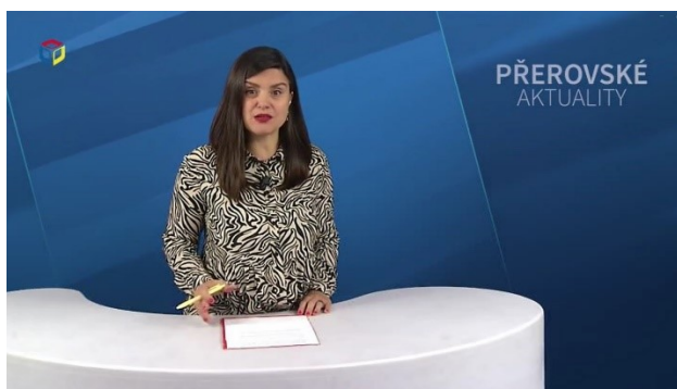
standardní umístění loga ve vysílání

Nyní tedy konstatujeme, že dne 20. září 2022 absentovalo označení programu po většinu vysílacího času, konkrétně např. v časech: 16:00-16:26, 18:00-18:26 nebo 19:00-20:25 hodin. Navrhujeme proto opětovně provozovatele na porušení zákona upozornit. Viz návrh usnesení na konci tohoto materiálu.