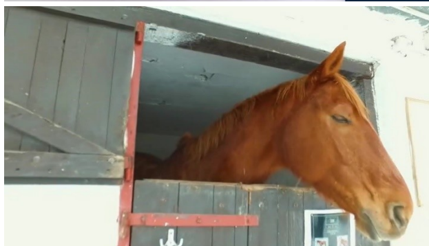
vysílání pořadu s absencí loga